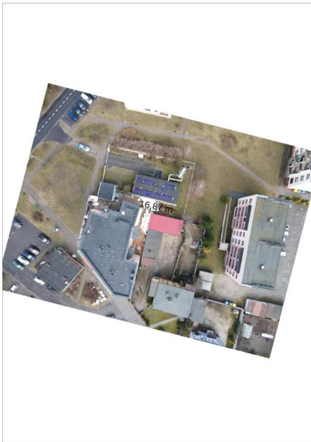
Figura 2: Umieszczenie generatora fotowoltaicznego i grupy konwersji